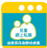
兒童網上私隱 給家長及老師的建議