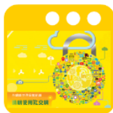
精明使用社交網 了解如何在社交網絡保護自己